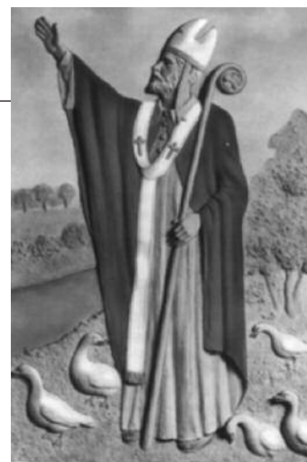
S. BAUDOLINO Patrono della città e Diocesi di Alessandria

E' possibile avvalersi dell'autocertificazione per comunicare il conseguimento dei suddetti titoli, utilizzando gli appositi moduli reperibili presso la Segreteria dell'Ordine ed indicando tutte le notizie riguardanti la specialità conseguita.